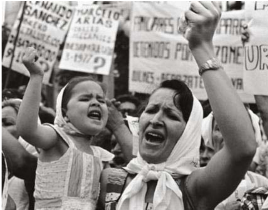
Madre e hija., 1982.

Para comenzar desde sus inicios, la fotógrafa declara: “...Hay una foto de Dorothea Lange que yo considero fundante para mi trabajo: es ésta de una mujer con sus hijos en la época de la depresión. (Ver apéndice).Fue verla y decidir que iba a ser fotógrafa...Y hasta quizá venga de ahí esta foto que tomé en una manifestación en la plaza de Avellaneda, en la que una madre con el pañuelo blanco grita con su nena en brazos. La saqué durante la dictadura. Era el año '82, hacía una semana que había empezado a trabajar en La Voz ... ”. (...) Para mí ésta es una foto que marcó mis trabajos. Todo lo que saque después vino de ésta de la madre con la nena. La mujer no está gritando por su hijo, está gritando por su hombre desaparecido la nena por el padre....”. 9